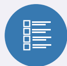
ENCUESTAS Y CUESTIONARIOS