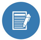
NOTAS DE CAMPO