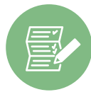
LISTA DE COTEJO O GUÍA DE OBSERVACIÓN